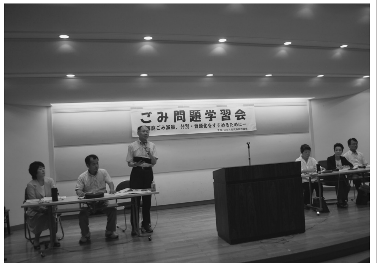
ごみ減量学習会(8月31日)

8月31日、ごみ問題学習会を開催し、約70人が参加しました。富士市は、一人1日77g減量を目指し、環境教育に取り入れていること、行政が雑紙、ペットボトル、古着まで資源回収し、行政と市民が協力してごみ減量を目指す取組が報告されました。一方、静岡市は、行政が徹底してごみを減らす姿勢がないところに問題があります。参加者から、「ごみ減量の具体的な取り組みを」「古紙回収をやめたことは問題あり」「生ごみ処理を徹底しよう」など積極的な意見が交換されました。市議団は、「ごみ問題Q&A」を作成し、市民と行政が協力し、ごみ減量を推進することを呼びかけています。