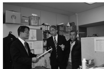
要請をうける議員団

消費税廃止静岡県各界連絡会は1月28日、消費税の実施を中止させるため、意見書の提出を求める請願を出した。その紹介議員になってほしいとの要請に共産党市議団を訪ねました。市議団は要請を受託する。 と、ともに、かたがた誓います。 消費増税は、市民生活に大きな負担をかける。増税は、経済を冷え込ませ、雇用を減らす。増税は、社会不安を醸成する。増税は、格差を拡大する。増税は、未来を暗くする。増税は、希望を奪う。増税は、夢を壊す。増税は、命を奪う。増税は、未来を暗くする。増税は、希望を奪う。増税は、夢を壊す。増税は、命を奪う。