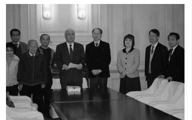
肺炎球菌署名提出