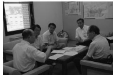
申し入れする議員団

七間町の映画館跡地を市が買い取り、上下水道庁舎を建設することになっていますが、市議団はアンケートにもとづき要望書を作成、提出しました。要望書は、子どもたちが下水道の仕組みや水と自然を学べること、市街地の活性化に寄与できること、市民がつよい活用できる施設にするために、会議室や中小ホール、展示室、自然博物館などを設置するよう求められています。上下水道局長は、要望の各項目について、検討してみたいと答えました。