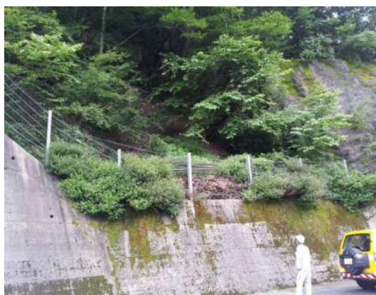
道路パトロールの様子