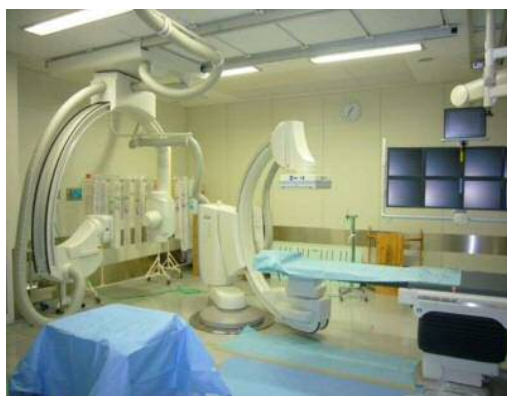
(心臓血管撮影装置)