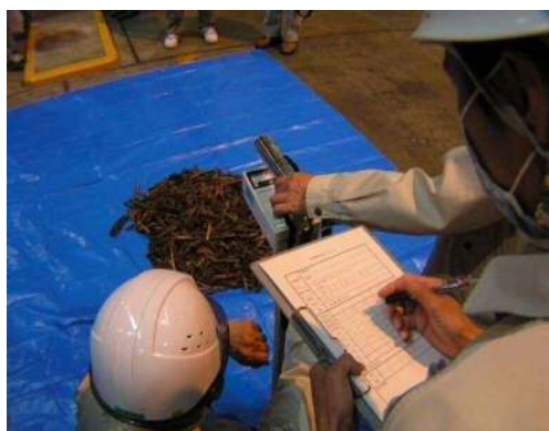
測定の様子(試験焼却時の例)