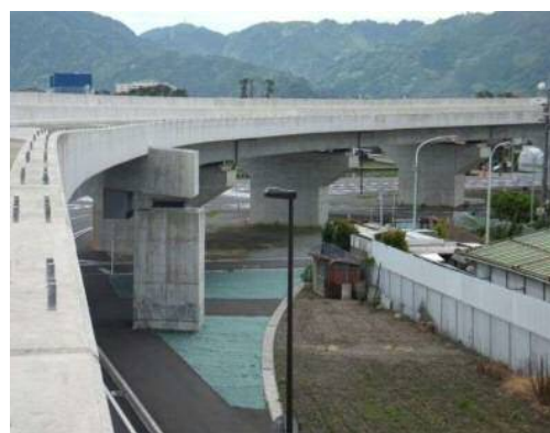
国道150号(静岡バイパス高架橋)