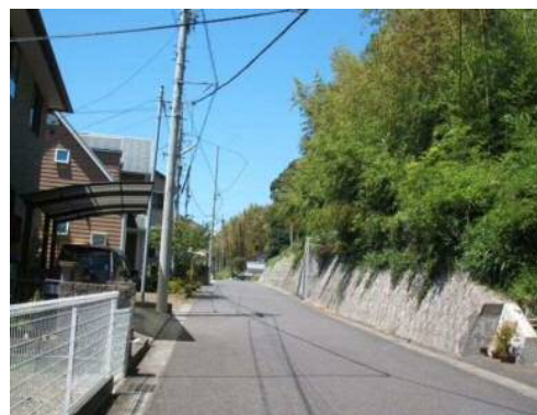
大谷土地区画整理事業区域に隣接する法面