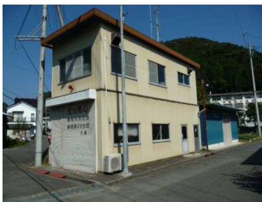
消防団施設の現況