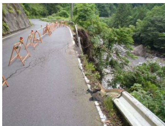
(県)三ツ峰落合線(落合)の状況(応急修繕前)