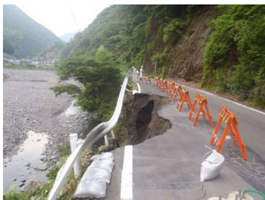
(主)梅ヶ島温泉昭和線(渡)の状況(応急修繕前)