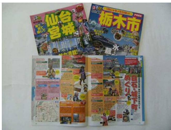
るるぶ特別編集号の他都市の例