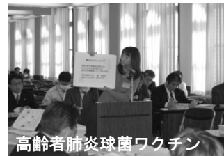
高齢者肺炎球菌ワクチン請願の趣旨説明をする市民

肺炎球菌ワクチン助成を求める請願は、自・公・新政会(民主含む)に加え「虹と緑」も反対、採択されませんでした。