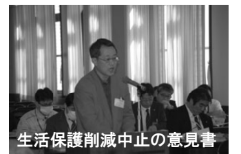
生活保護削減中止の意見書陳情の趣旨説明をする市民