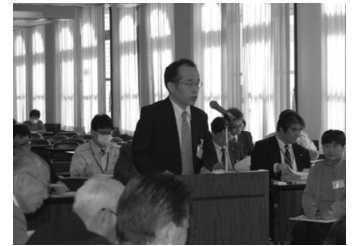
国保料引き下げ請願趣旨を説明する市民

政令市一高い国保料。払えないために病院に行くのをためらい、死亡を含む深刻な事例も報告されています。引き下げの請願が静岡、清水の市民団体から出されました。自・公・新政会(民主含む)が反対し16000人の声をふみにじりました。